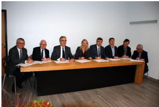
SIGNATURE CONTRAT TERRITORIAL Colmont Ernée 2021_2023

➤ Le PSE = un nouvel outil permettant une animation locale