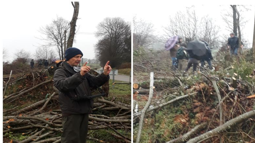
Animation : Olivier LEPAGE SCIC MBE_ Janvier 2021

Journées nationales d'échanges techniques Haies bocagères : liens de biodiversité dans les territoires 6 et 7 octobre 2021 - Caen