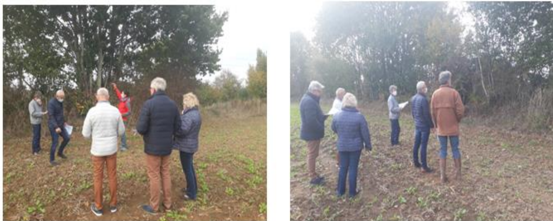
Animation : Emmanuel Lelièvre _ SCIC MBE _ Octobre 2020